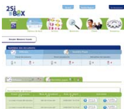
Intranet intuitif Suivi de gestion clientèle