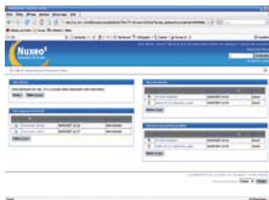
Gestion Electronique de Documents Espace de travail collaboratif avec clients